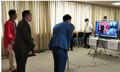
▲接続先のお客様に語りかけられる様子

ご自宅から遠方の会場へ出かけることなくイベントに参加できるため、集合型イベント開催時よりも多くのお客様にご参加いただいています。出演したよしもと芸人の方たちも、回を重ねるごとにオンラインでのイベントに慣れて、接続先のお客様に積極的に声をかけたりして頂いています。お客様にとっても、直接人芸人と双方向で会話でき、テレビ番組とは違ったオンラインならではの醍醐味を味わって頂いています。また、「ビデオ会議録画オプション」を使ってイベントの様子を録画して、イベント後は社内の資料として活用しています。