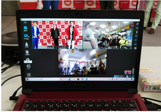
▲イベント会場とご販売店様を映してコミュニケーションをとる様子

イベントにご参加いただくのは、全国各地の家電ご販売店様。そのためさまざまな端末に対応しているTeleOfficeは有力候補でした。普段からWEB会議を使い慣れている方ばかりではないため、初めてでもわかりやすい操作感が求められました。TeleOfficeの操作画面は、日本語で直感的にわかりやすいユーザーインターフェースを採用しています。また、「指定切り替えモード」や「ビデオ会議制御オプション」の機能を使って、主催者側でお客様のビデオ会議への参加やマイク・カメラのON/OFF切り替えが行えたり、参加者の画面にどの会場を映し出すかの制御が行えることも、TeleOfficeを採用した大きな要因です。