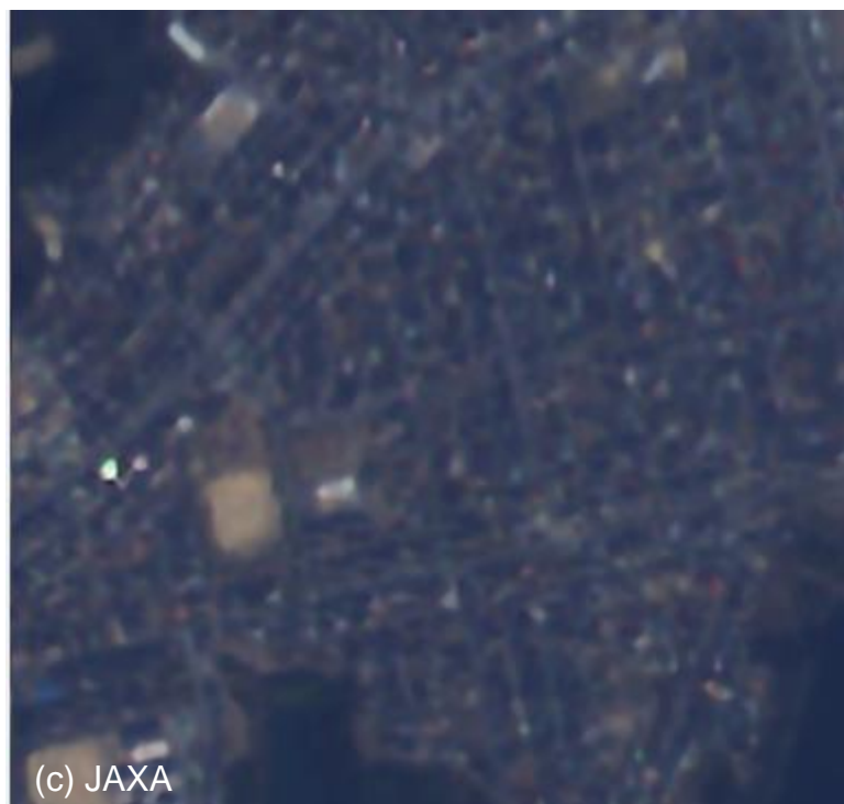
〔一般的なAI学習方式(SRCNN)〕