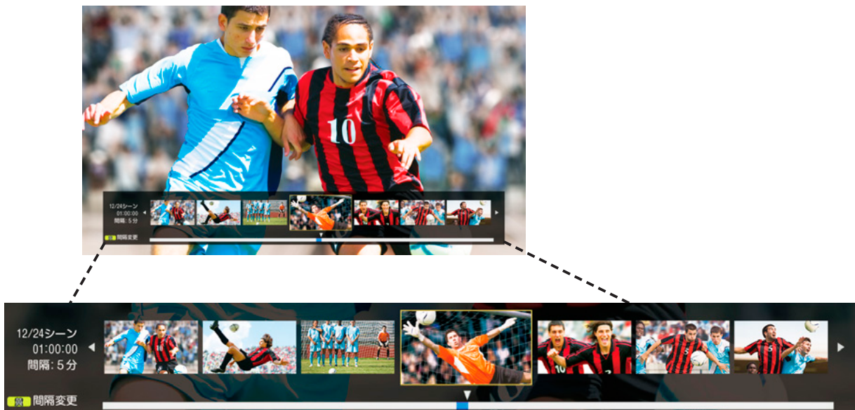
ポップアップ画面表示