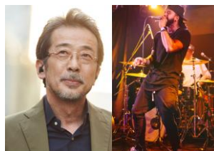
音楽鑑賞シーン (イメージ)

Not just as a hearing aid. As a wireless earphone, you can enjoy high-quality music and make hands-free calls.