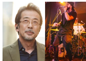
<音楽鑑賞シーン (イメージ)>