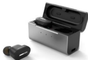
メディカルリスニングプラグ<MH-L1-B>

シャープは、ワイヤレスイヤホンスタイルの耳あな型補聴器「メディカルリスニングプラグ」<MH-L1-B>を発売します。