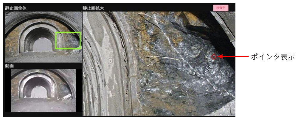
遠隔端末による切羽映像とポインタ表示画面例

山岳地でのトンネル工事現場など、高速通信環境の構築が困難な現場では、切羽の地質状況の確認に必要な高解像度での動画配信は困難です。そこで、本システムでは、まず、通信速度を左右する通信帯域に合わせて動画の画質を調整することで、安定した配信を実現。動画で全体状況を把握した後、詳細な確認が必要な箇所については、静止画の地質の凹凸や輪郭などを、当社が長年培ってきた画像処理技術で視認性を高めた上で伝送することで、遠隔地へも詳細な現場状況を共有できるようにしました。