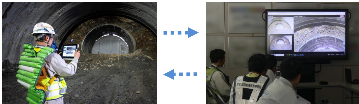
本システムによるトンネル坑内での撮影（左）と遠隔臨場の様子（右）

シャープは、鹿島建設株式会社（本社：東京都港区、代表取締役社長：天野裕正、以下鹿島建設）と共同で、山岳トンネル工事などでの確認・評価プロセスの生産性・安全性を向上させる、動画と静止画を組み合わせた「ハイブリッド遠隔コミュニケーションシステム」を開発しました。